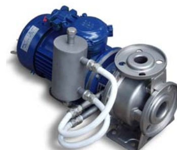
Комплектация двойным торцовым уплотнением и бачком гидрозатвора