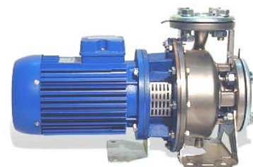
Комплектация контрфланцами и крепежом