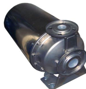
Комплектация кожухом на электродвигатель