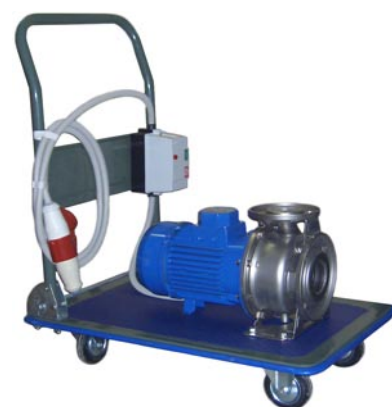
Установка на тележку, комплектация пускателем

НПП «НАСОСЫ и УПЛОТНЕНИЯ» изготавливает насосы других типов, а также поставляет торцовые уплотнения валов фирмы «Джон Крейн» (Англия) для отечественных и импортных насосов и мешалок, муфты для соединения валов и передачи крутящего момента POWERSTREAM METASTREAM.